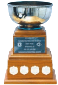
La coupe Financière Sun Life

prix à l'OMC, et le lauréat du premier prix reçoit la coupe Financière Sun Life. De ces huit gagnants, les six qui ont le mieux réussi à l'OMC sont choisis pour participer à l'Olympiade internationale de mathématiques, point culminant du concours, qui se tient chaque année dans un pays différent. Nous soutenons la Société mathématique du Canada depuis 1947 et, en 2010, nous lui avons réitéré notre appui pour une nouvelle période de cinq ans en nous engageant à lui donner une somme de 175 000 $ et en lui en versant la première tranche de 35 000 $.